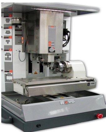
REVO 540 fraiseuse 4 axes

Démonstrations de Matrix et l'exposition des modèles issus de la Envisiontec AUREUS ou Perfactory 3, avec son environnement bijouterie, résine pour casting direct, résine pour fabriquer les moules caoutchouc.